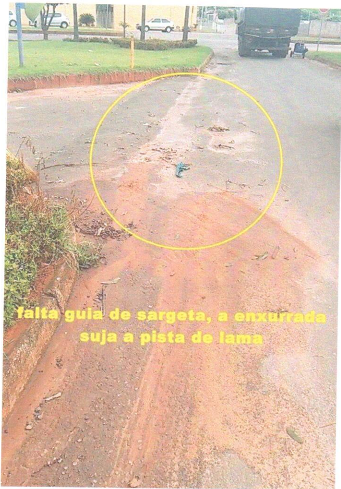
falta guia de sargeta, a enxurrada suja a pista de lama