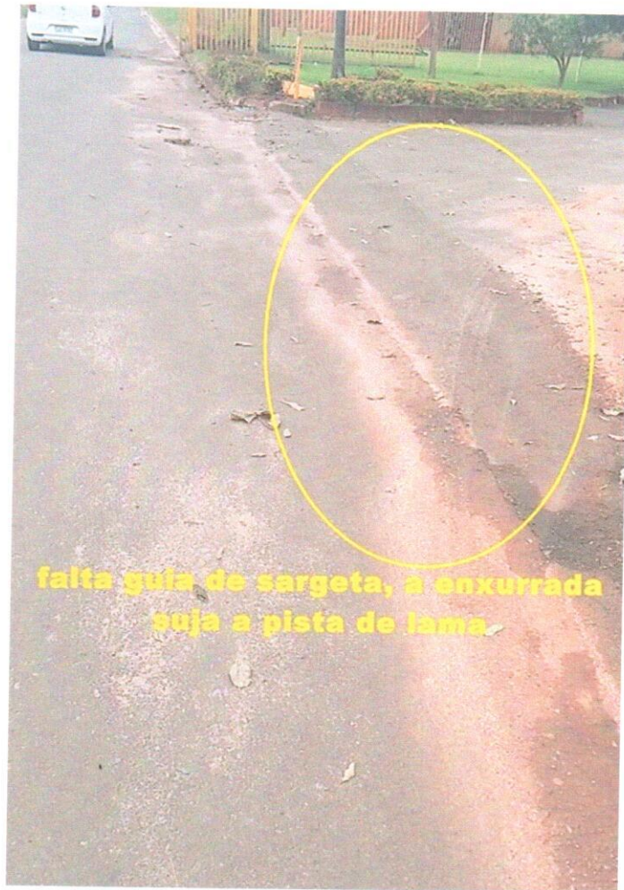
falta guia de sargeta, a enxurrada suja a pista de lama