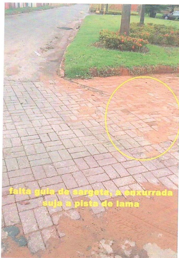
falta guia de sargeta, a enxurrada suja a pista de lama