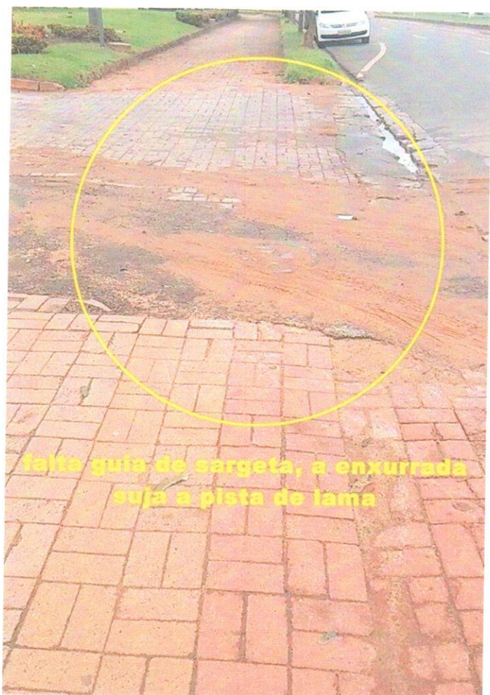
falta guia de sargeta, a enxurrada suja a pista de lama