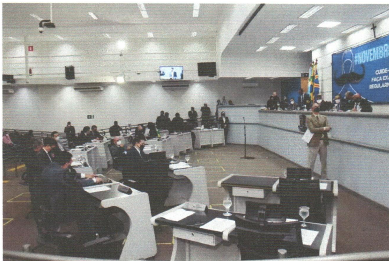
Câmara aprovou dez projetos de lei nesta terça (30).

Os vereadores da Câmara Municipal de Campo Grande aprovaram, na sessão desta terça-feira (30), dez projetos de lei. Entre eles, está o Projeto de Lei n. 10.336/21, que implementa o incentivo financeiro “Auxílio Atleta”.