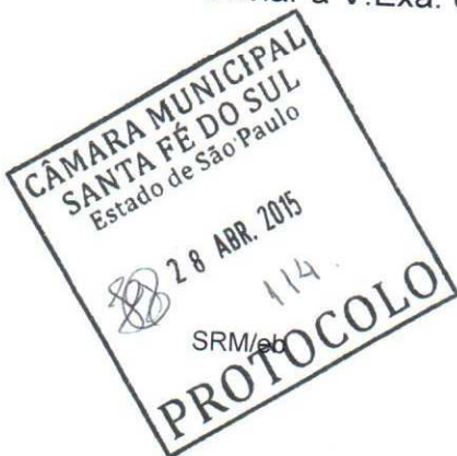
Rubens E. Cury Subsecretário da Casa Civil