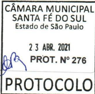
Evandro Farias Mura Prefeito Municipal

CÂMARA MUNICIPAL SANTA FÉ DO SUL Estado de São Paulo APROVADO em Sessão de 27 / 04 / 21