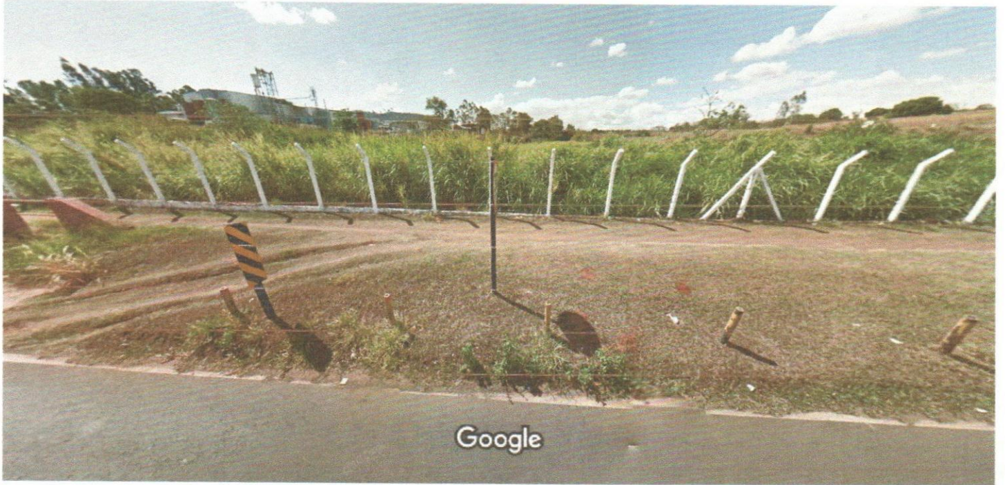
Captura da imagem: out. 2011