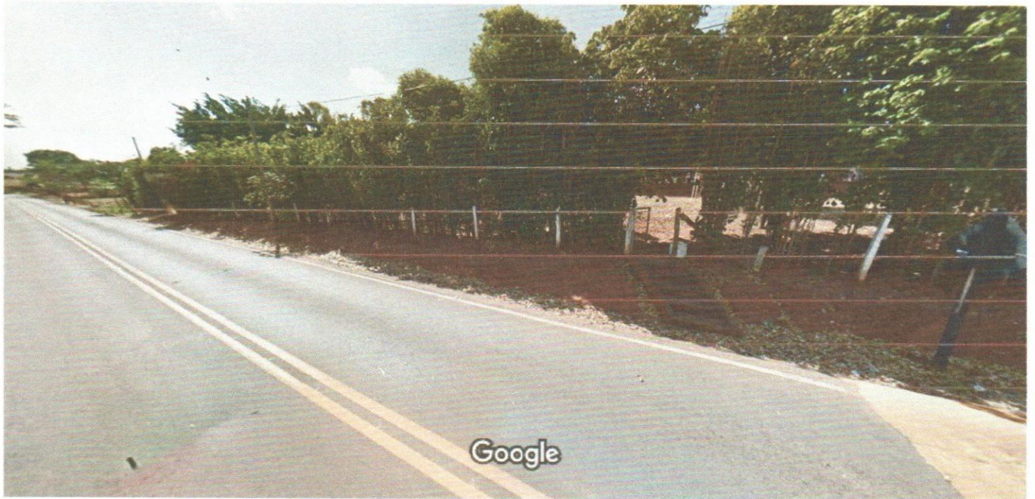
Captura da imagem: out. 2011