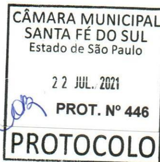
Evandro Farias Mura Prefeito Municipal

CÂMARA MUNICIPAL SANTA FÉ DO SUL Estado de São Paulo APROVADO em Sessão de 23 / 07 / 21