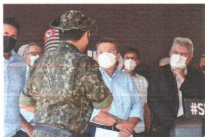
Convênio foi assinado na manhã deste sábado em Votuporanga