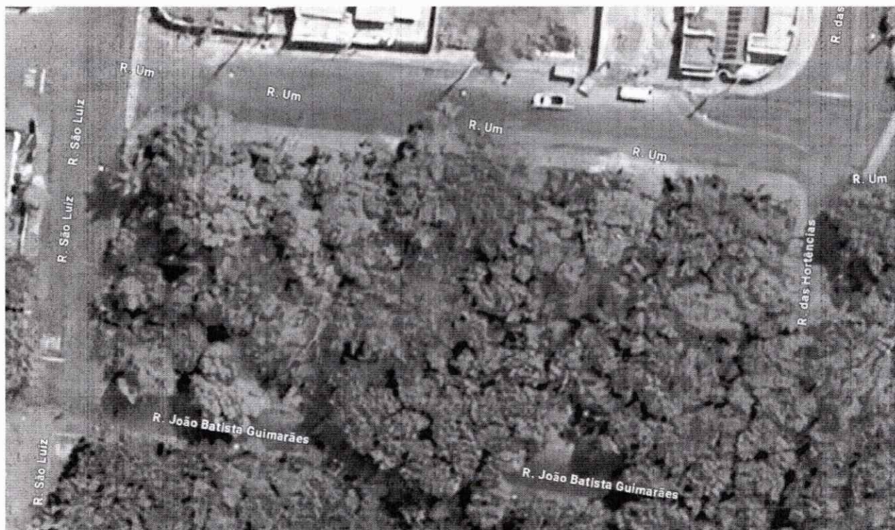
Figura 2: O quarteirão formado entre as Ruas São Luiz, Rua Um, Rua João Batista Guimarães e Rua das Hortências possui aptidão ímpar para receber uma pista de caminhada ecológica no calçamento ao seu redor.

Mister ressaltar que esse pequeno investimento, além de alta vantagem à população, serviria para refrear dois crimes recorrentes ali praticados: o abandono de animais e a poluição por descarte de lixo (artigos 32 e 54 da Lei 9.605/98).