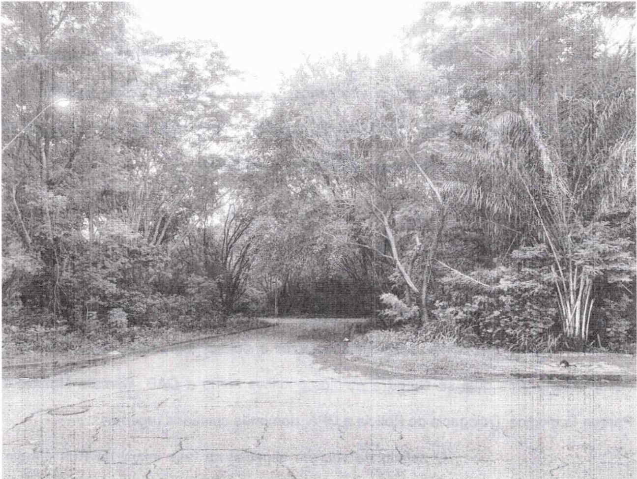
Figura 1: Asfalto com muitas rachaduras, sem sinalização.

Especialmente entre as Ruas São Luiz e Rua das Hortências, a Rua Um demanda cuidados urgentes. Notem-se as fotografias lá tiradas: