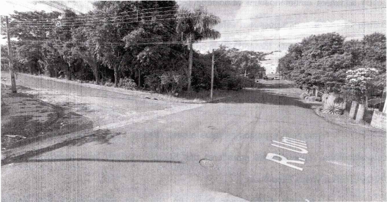
Figura 4: Rua Um em intersecção à Rua São Luíz. Falta sinalização e recape na via. Área verde sem calçamento e falta de um quebra-molas próximo ao cruzamento do Jardim Alvorada ao Jardim Villa Lobos.