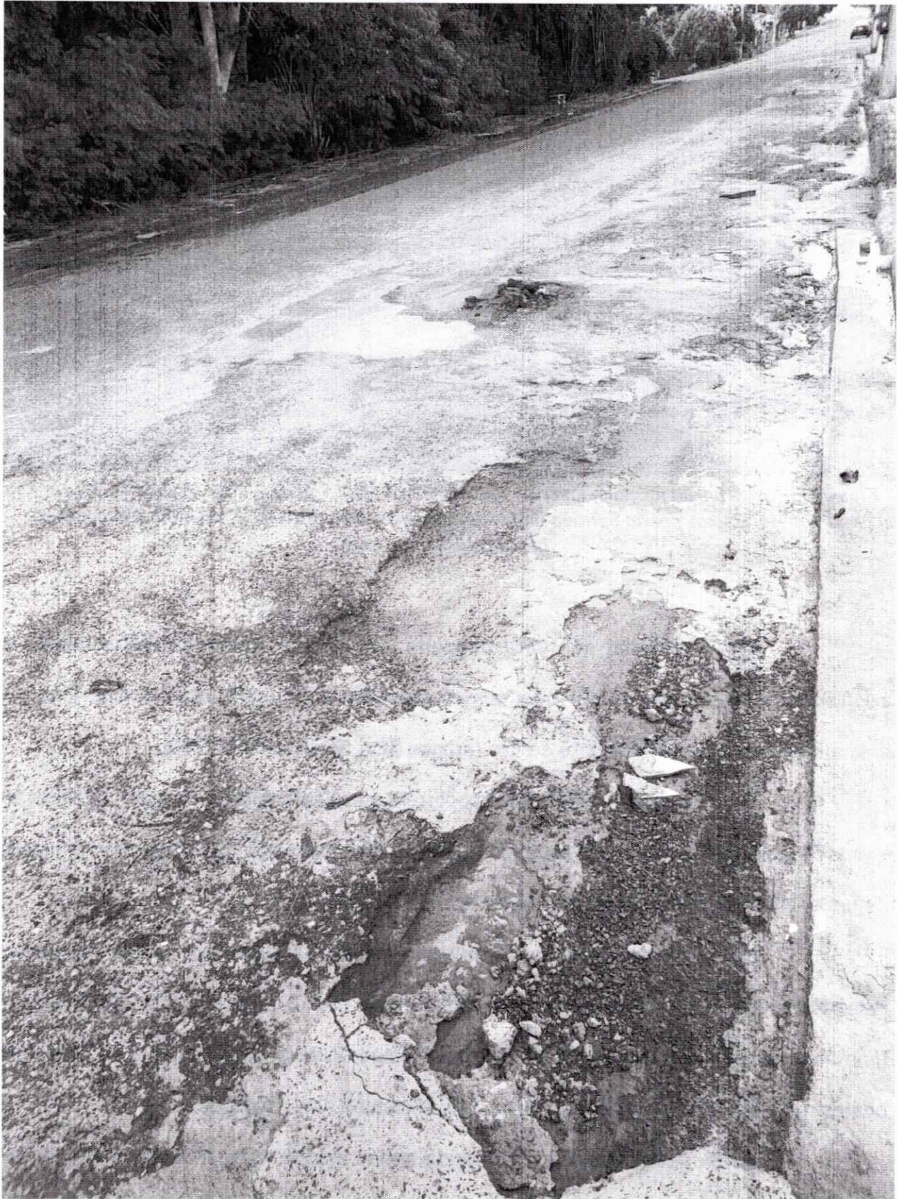
Figura 3: Crateras abertas pela força das águas e ação do sol e tempo ao longo dos anos sem manutenção.