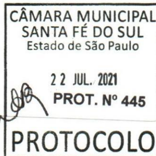
Evandro Farias Mura Prefeito Municipal

CÂMARA MUNICIPAL SANTA FÉ DO SUL Estado de São Paulo APROVADO em Sessão de 23 / 07 / 21