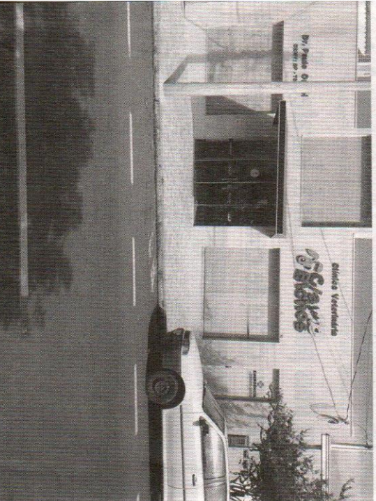
Estacionamento defronte à clínica veterinária, sem demarcação de vaga

O Jornal entrou em contato com a assessoria de comunicação da Prefeitura de Santa Fé do Sul para ter uma posição sobre o caso, porém até o fechamento desta edição não obteve resposta alguma.