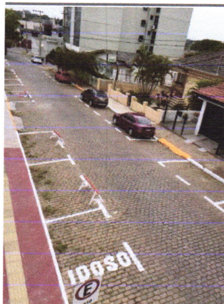
Rua 15 de Novembro: um dos três locais que recebeu pintura

Centro Clínico do Hospital de Caridade e Beneficência, Colégio Marista Roque e Edifício Labor, na Rua 15 de Novembro, foram os primeiros parceiros. Com a tinta doada, o Setor de Trânsito garante a mão de obra e faz a pintura que serve como base para o motorista ocupar um espaço para apenas um carro. Cada espaçamento tem 5,5 metros de comprimento. A iniciativa visa orientar os condutores para que dois veículos não ocupem vagas em que caberiam três carros.